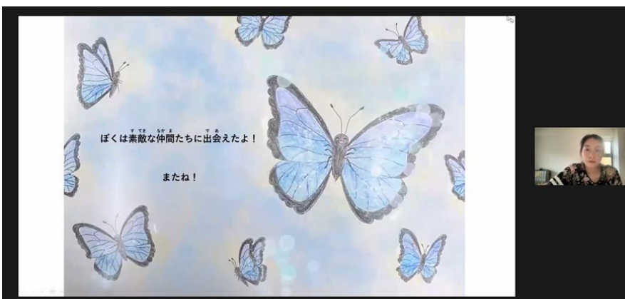
留学生による絵本動画紹介