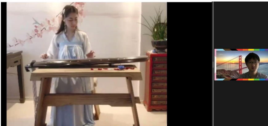
留学生による楽器演奏

新型コロナウイルス感染拡大の影響で渡日や海外渡航が困難な情勢が続いている状況ですが、名古屋市立大学ではオンラインも活用し、国際交流を積極的に進めています。