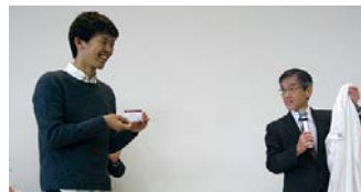
スチューデントドクター認定証と白衣を授与されました