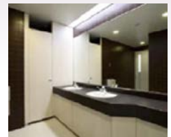
基礎教育棟トイレ