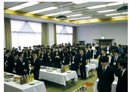
新生歓迎会の様子